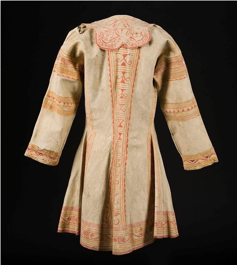
Manteau, Premiers peuples; Innus; Naskapis Musée de la civilisation du Québec. Période: 4 e quart du 18 e siècle. Groupe ethnolinguistique: Algonquien. Peau, caribou; métal. 18 x 77 cm