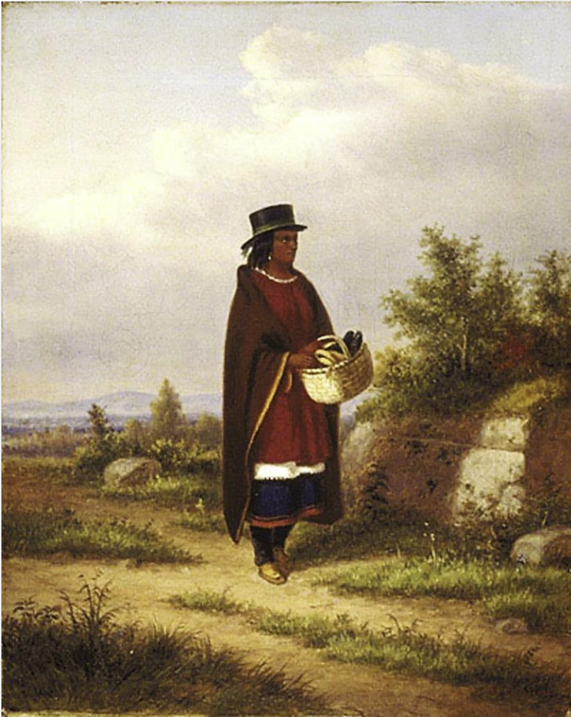
Cornélius Krieghoff, L'Indienne avec un panier , vers 1860, Huile sur toile, 28,3 x 23 cm Collection du Musée national des beaux-arts du Québec