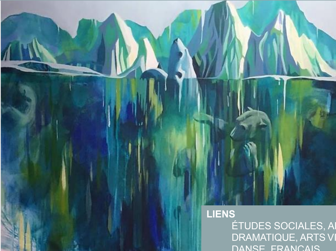
Œuvre Dominique Normand