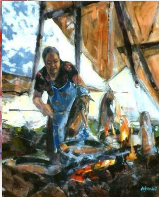
Cooking Geese, Acrylique sur toile, 2014, photo de l'artiste

L'été les femmes cries (ou autochtones) préparent les longs mois d'hiver. La chasse et la pêche ont été bonnes.