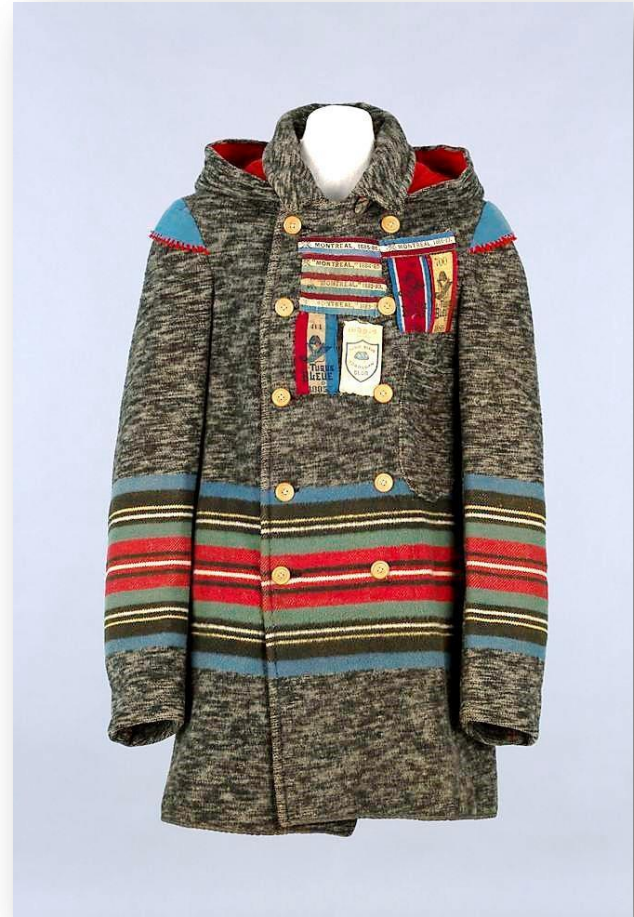
Manteau de raquetteur, 1880 Musée de la civilisation. Artisanal; tissé; imprimé; taillé; assemblé; cousu. Laine, soie, coton, corne; encre. 96 x 54 cm