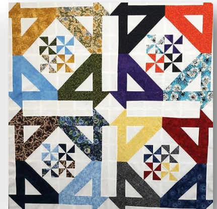
Motifs et photographies de Diane Greer