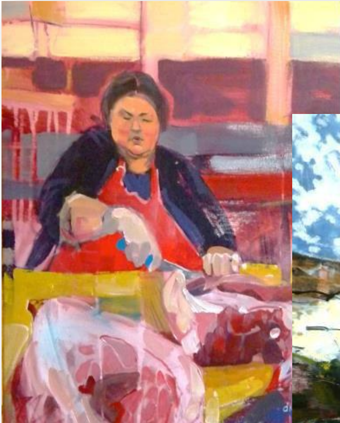
Meat Cutter, Acrylique sur toile, 2014, 50,8 cm x 60,9 cm

Dominique Normand , artiste peintre, de souche Mi'kmaq et Malécite, visite depuis 11 ans les Cries, une deuxième famille pour elle. Elle documente ce qu'elle voit par la peinture, comme le faisait Cornélius Krieghoff.