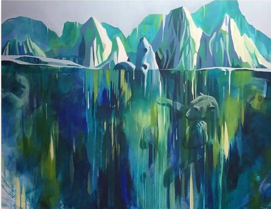
Swimming Bears , Acrylique sur toile, 2017, 76,2 cm x 101,6 cm

« Lors de notre périple sur la côte Atlantique, nous sommes venus à la rencontre des géants blancs, icebergs en déplacement vers le sud. Pour moi, ce fut une révélation. »