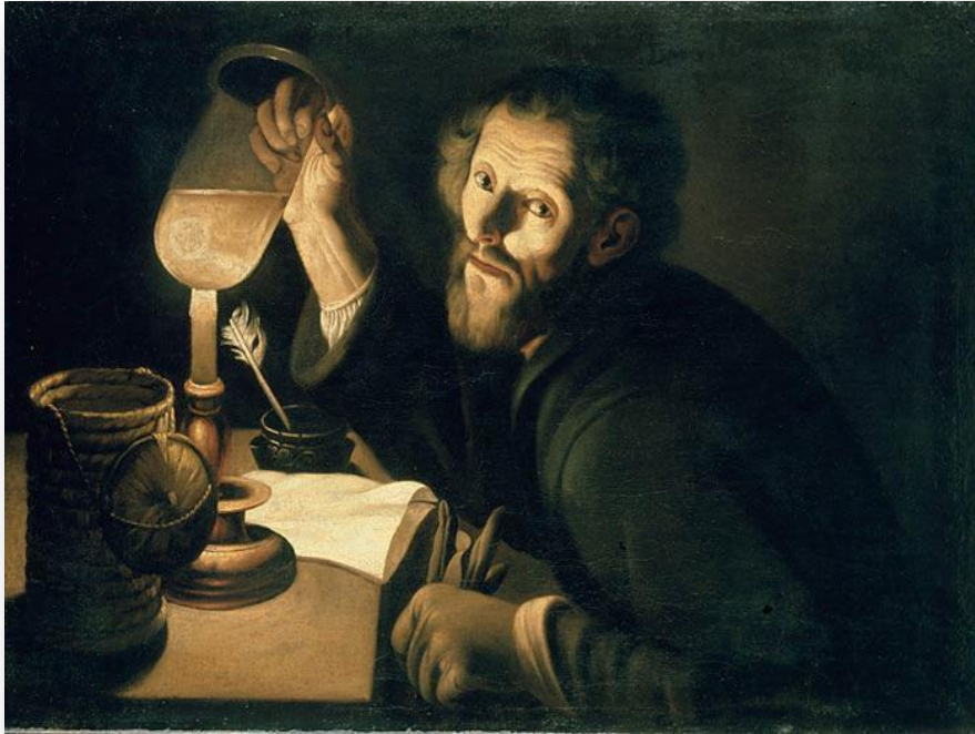
Médecin avec un échantillon d'urine, tableau du Maître à la Chandelle, vers 1620-1640. Ashmolean, Museum, University of Oxford.

En Nouvelle-France, chaque ville possède un hôtel-Dieu (hôpital). Les chirurgiens, médecins et apothicaires travaillent avec l'aide des congrégations religieuses.