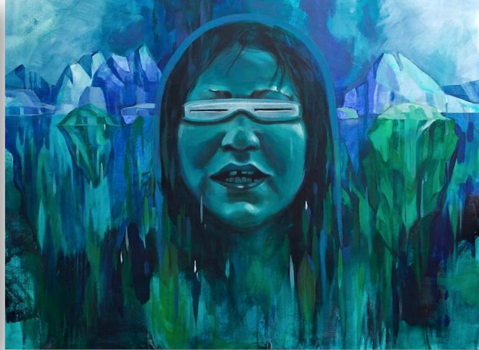
Drowning on Land , Acrylique sur toile, 2017, 76,2 cm x 101,6 cm