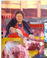
Meat Cuts, Acrylique sur toile, 2014 50,8 cm x 60,9 cm

L'artiste Dominique Normand retourne sur les traces de ses racines. Cris et documente ce qu'elle voit par la peinture, comme le faisait Cornélius Kriehhoff .