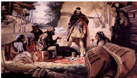
*Radisson et Des Groseliers établissant le commerce des fourrures dans le Nord-Ouest, 1662», Archibald Bruce Stapleton, 20e siècle, 47 x 72 cm.

Les Autochtones aiment les batailles. Deux peuples des Premières Nations, les tribus huronnes et algonquines se rangent du côté des Français, si ceux-ci participent aux combats contre les Iroquois qui sont hostiles aux Français.