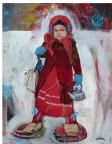
Snowfall Ceremony, Acrylique sur toile, 2014, 40x 50,8 cm