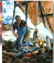
Cooking Geese, Acrylique sur toile, 2014