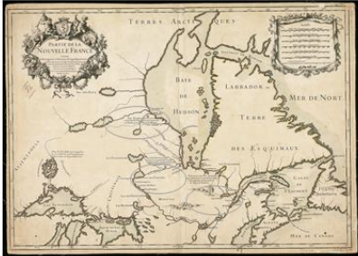
INDIQUANT L'EMPLACEMENT... postes de traite

Traite des fourrures : Pourquoi la traite des fourrures a-t-elle contribué à l'exploration d'une bonne partie du Canada ?