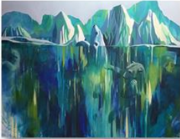
Swimming Bears, Acrylique sur toile, 2017, 76,2 cm x 101,6 cm

« Lors de notre périple sur la côte Atlantique, nous sommes venus à la rencontre des géants blancs, icebergs en déplacement vers le sud. Pour moi, ce fut une révélation.