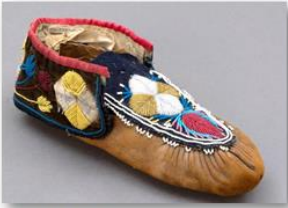
Musée de la civilisation Moccasin fait dans une pièce de cuir tannée sur les bords pour couvrir le pied

Les femmes algonquines partagent leurs connaissances avec leurs filles. La liste des occupations est longue : savoirs sur les plantes médicinales, les colorants, le tannage des peaux, l'artisanat, etc.