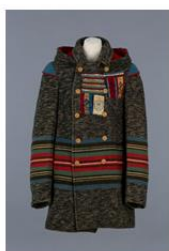
Montagne de raquetteur, 1880 Musée de la civilisation, Artisanat Tissé: Imprimé, Tissé, Assemblé, Couse Fibre: Laine, Soie, Coton, Corne, Encre 96 x 54 cm

Comment les échanges entre les communautés autochtones et les Européens ont-ils influencé les vêtements? Qu'ont emprunté les Européens aux peuples autochtones pour relever les défis liés au climat et au territoire canadien?