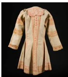
Montagne, Premier Peuple, Inuit, Montagne Musée de la civilisation du Québec PÉRIODE 4e quart au 18e siècle GROUPE ETHNOLINGUISTIQUE Aïgonalien, Peau, caribou, Métal, 18 x 77 cm