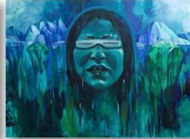
Drowning on Land, Acrylique sur toile, 2017, 76,2 cm x 101,6 cm