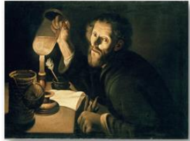
Médecin avec un échantillon d'urine, tableau du Maître à la Charolette, vers 1620-1640, Art Museum, University of Oxford

En Nouvelle-France, chaque ville créée possède un hôtel-Dieu ou hôpital. Les chirurgiens, médecins, apothicaires travaillent avec l'aide des congrégations religieuses.