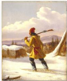
Cornélie Krieghoff, chasseur d'hiver, vers 1838, huile sur toile, 26,4 x 23,7 cm, Collection du Musée national des beaux-arts du Québec

Les jours d'hiver; on s'adapte au climat!