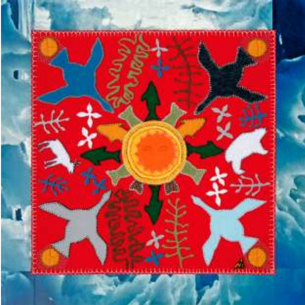
Fuseau horaire 3 de la série des six murales Fuseaux horaires 2010 Techniques mixtes, 244 x 244 cm Collection Institut Historica-Dominion Ottawa, Ontario