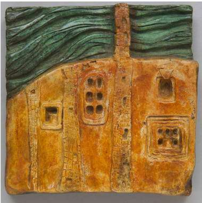
Ma maison 2006, bas-relief en bronze, 15 x 15cm