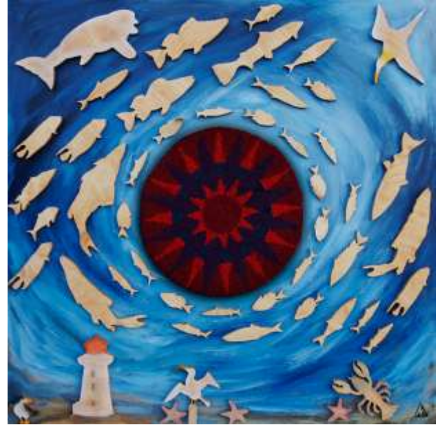
Fuseau horaire 4 de la série des six murales Fuseaux horaires 2010 Techniques mixtes, 244 x 244 cm Collection Institut Historica-Dominion Ottawa, Ontario