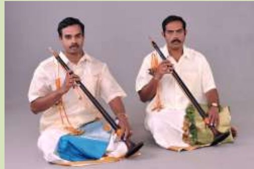
Joueurs de nâgasvaram