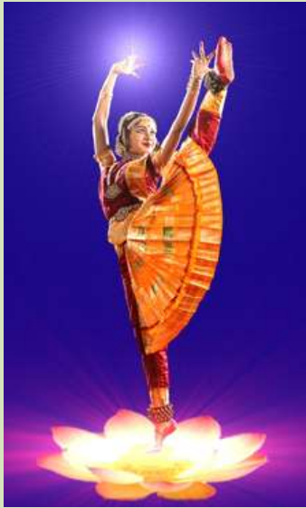
Danseuse de bharata natyam

http://en.wikipedia.org/wiki/Bharatanatyam