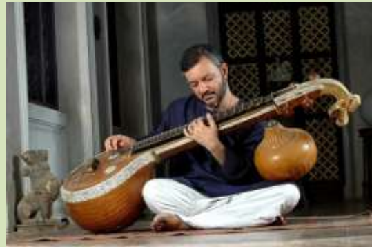
Joueur de la vina, une cithare indienne