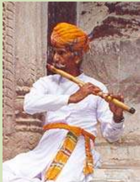
Flutiste de la venu