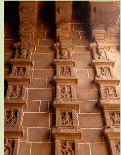
Le temple Nataraja

À Chidambaram, en Inde, le temple Nataraja étale les 108 postures de la danse sacrée, à droite.