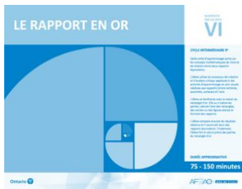
Version intégrale LE RAPPORT EN OR