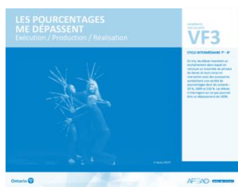
VF3 Exécution / Production / Réalisation