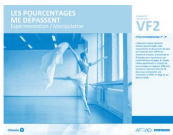
VF2 Expérimentation / Manipulation