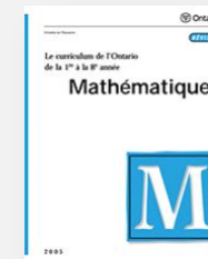
Mathématiques 7 e : A3.6 8 e : A3.6