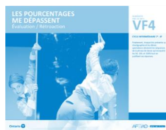
VF4 Évaluation / Rétroaction