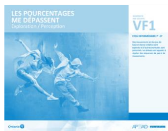
VF1 Exploration / Perception