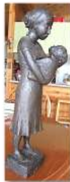
Mère et enfant, 1994 (sculpture coulée en bronze)