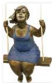
Balançoire, Bronze patiné, 46x30x16 cm (série de 8) 2002

Diaporama LA RONDE DES BALANÇOIRES activité de sculpture 6 e année (diapos 10-11) Fiche 1 — Analyse œuvre Balançoire