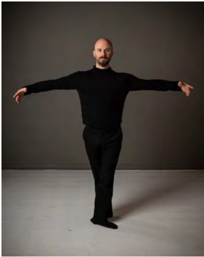
Je plane grâce au vent.