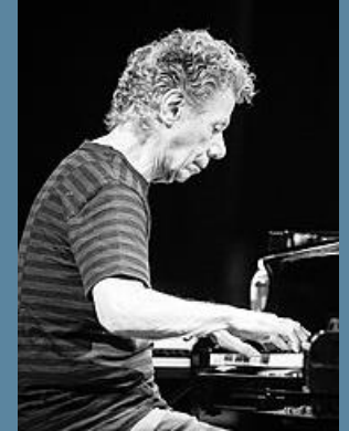
Jazz fusion. Rock.progr.

Carlos Santana (1947- ) Singing Winds, Crying Beasts