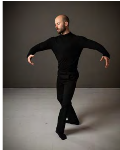
Je tourbillonne avec le vent.