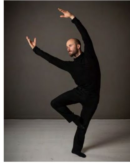
Je plie sous la force du vent.