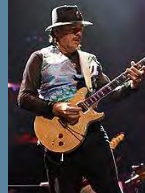
Rock, blues, jazz fusion

Carlos Santana (1947- ) Singing Winds, Crying Beasts