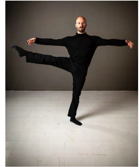
Je m'envole porté par le vent.