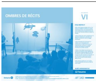
Version intégrale OMBRES DE RÉCITS