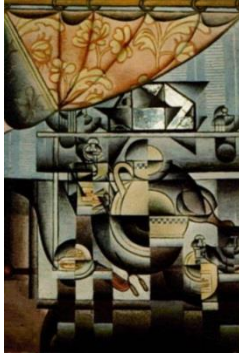
Le Lavabo , 1912

Huile sur toile avec papier collé et miroir 127,5 x 87,5 cm