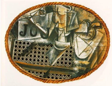
Nature morte à la chaise cannée , 1912, Peinture à l'huile, toile cirée, carte et corde sur toile. 29 x 37 cm