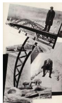
Alexander Rodchenko, Sans titre , 1923, photomontage, environ 10x 13 cm

http://fr.wahooart.com/@/8XXMRF-Alexander-Rodchenko-Composition