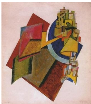
Alexander Rodchenko, Composition , 1917, collage, 40x35 cm

Alexander Rodchenko est connu pour ses collages composés de photos prises de diverses sources et combinées dans des montages évocateurs. Ce qu'il y a de révolutionnaire dans sa technique, c'est le choix des éléments qu'il combine ainsi que leur disposition inusitée.