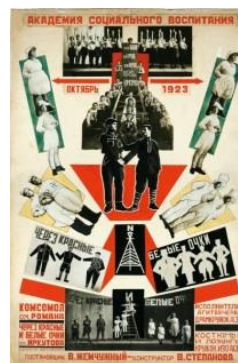
Varvara Stepanova, Through Red and White Glasses , collage affiche, 1924 http://www.tate.org.uk/context-comment/articles/short-life-equal-woman