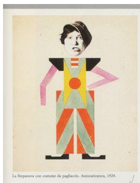
Varvava Stepanova Caricature , 1924, collage https://www.pinterest.com/johnlandberg/russian-avant-guard-stepanova/

Varvava Stepanova a créé des designs originaux de vêtements sport, des affiches et des costumes pour le théâtre. Avec son conjoint Alexander Rodchenko, Stepanova a créé l'œuvre intitulée Книги (Livres!) . L'affiche aux formes simples, au plan très géométrique et aux couleurs en aplat, a servi à promouvoir l'éducation des ouvriers soviétiques.